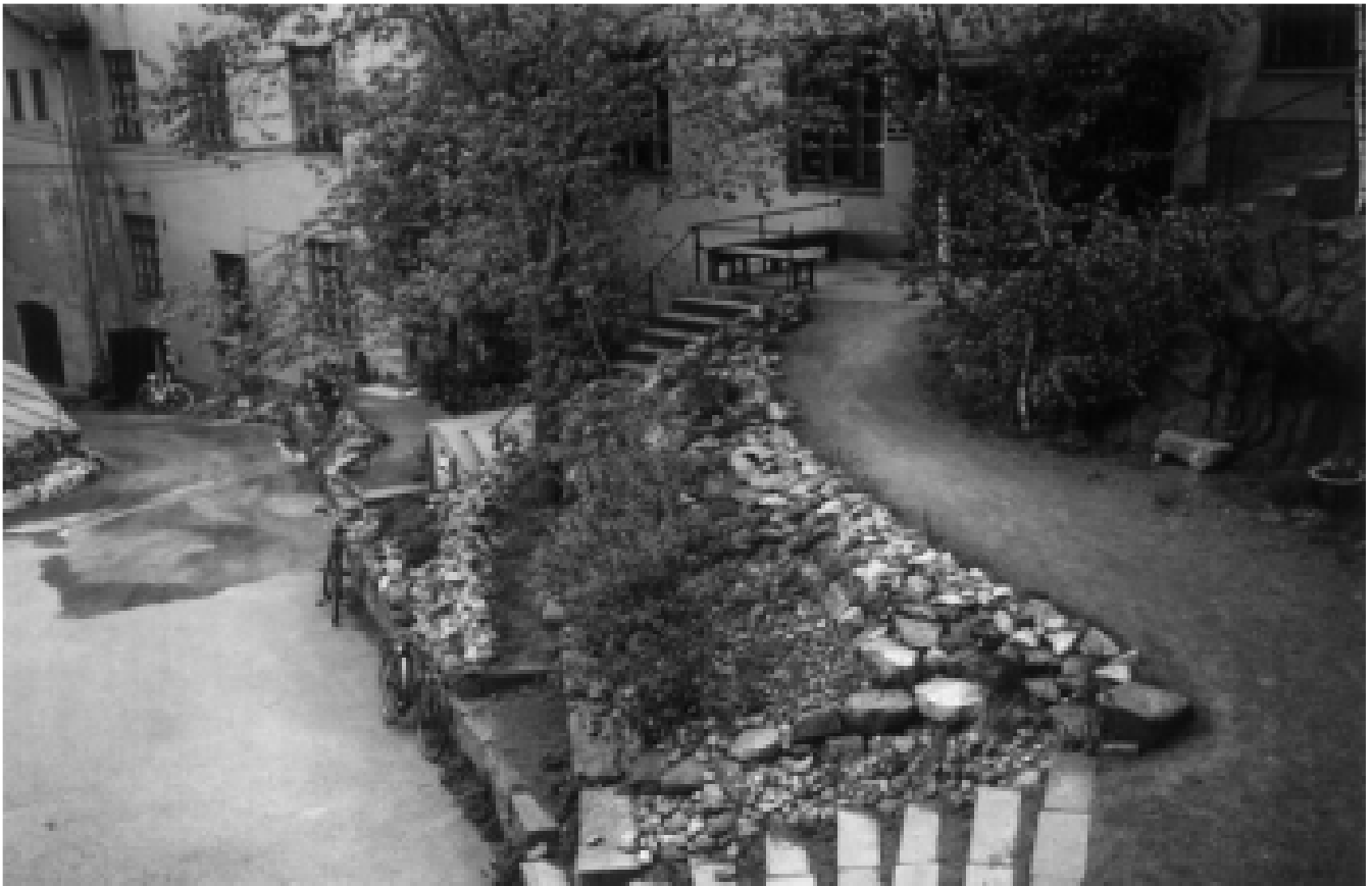
Manillan sisäpihaa, jonka toivoisi tulevan tutuksi kaikille martinrantalaisille.

Martinrantaseura on saanut järjestää lyhyenä olemassaoloaikanaan jo kaksikin tapahtumaa Manillan tiloissa. Toivottavasti jatkossakin. Seuraavaksi pääsemme käymään talossa joulukuun 7. päivänä jo perinteisenä laulelmailtana, tällä kertaa uuden Makasiini-salin tiloissa. Vuoden 2006 aikana tulemme tekemään perusteellisen tutustumisretken taloon ja sen värikkääseen historiaan.